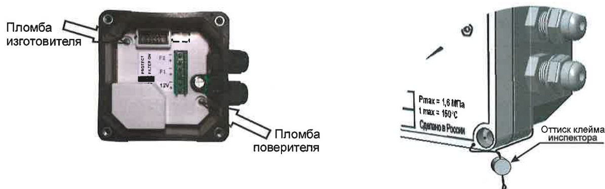
Рисунок 4 – Места пломбирования ЭБ исполнения 1

В целях предотвращения доступа к узлам регулировки и настройки, а также к элементам конструкции, предусмотрены места пломбирования, указанные на рисунках 4 и 5.