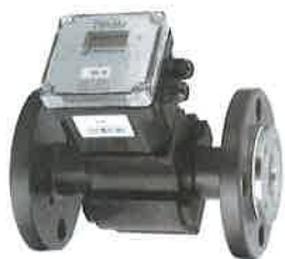
Рисунок 1 – Внешний вид преобразователей с ЭБ исполнения 1