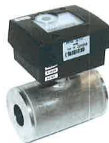
Рисунок 2 – Внешний вид преобразователей с ЭБ исполнения 2